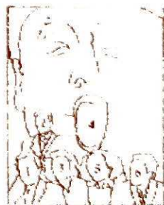
Ilustraciones de la cubierta de Adios, Poeta... de Jorge Edwards © TUSQUETS EDITORIAL S.A. Diseño: Juan Pablo de Soto Foto: Jorge Edwards, © Juan Argente 65 Mino Varga-Uccia